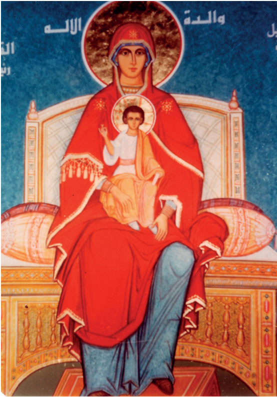
Abisence em Hame -Sina