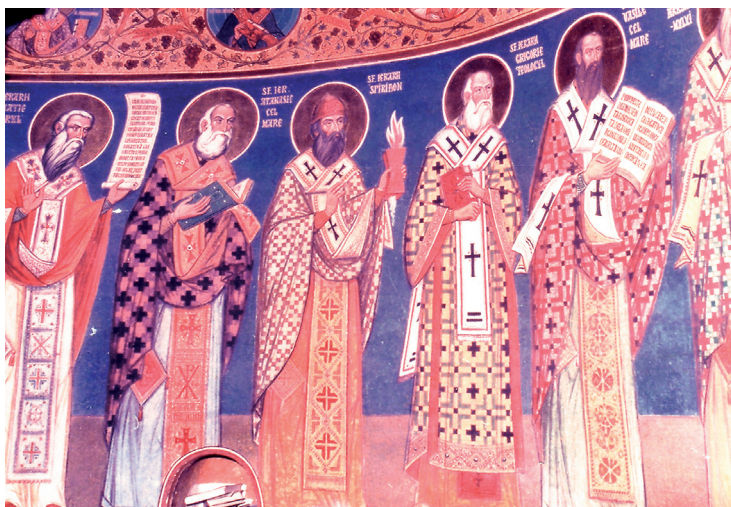
Sfinții Ierarhi, Sfântul Altar Mănăstirea Radu-Vodă, București