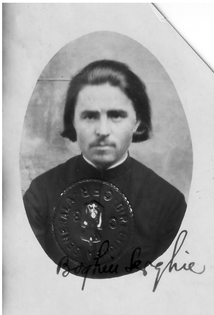
Fotografia de pe abonamentul eliberat de Direcțiunea Generală CFR