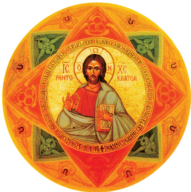
Iisus Hristos Pantocrator Turla bisericii Mănăstirii Dealu, pictată în anul 1989 de Părintele Sofian Boghiu