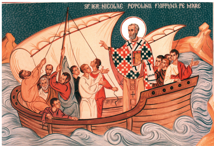
Sfântul Ierarh Nicolae potolind furtuna Mănăstirea Dealu