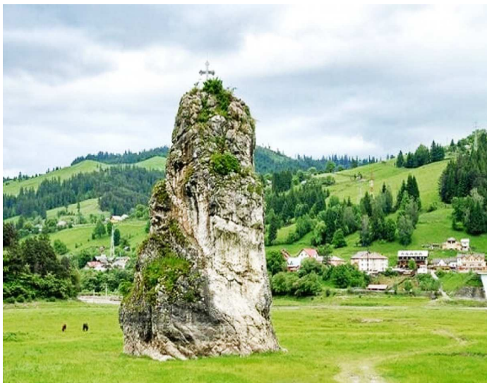
Piatra Teiului și crucea așezată în amintirea eroilor de pe Valea Muntelui

mai apropiate sau mai îndepărtate. Au fost dărâmate și bisericile de sub oglinda lacului, și doar unele strămutate în diferite locuri. Unele dintre ele erau monumente istorice, ca, de exemplu, biserica din satul Răpciune, comuna Ceahlău, strămutată la Muzeul Satului din București, altele construite recent cu mari sacrificii ale enoriașilor, în condiții de război și de foamete, ca Biserica din Hangu, terminată și sfințită în 1948 și dărâmată prin dinamitare în 1958,