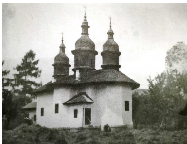
Biserica „Sfântul Nicolae” de lângă Piatra Teiului strămutată în 1960

rate la fisc, considerați, după expresia binecunoscută în epocă, „dușmani ai poporului”. În zona de munte, o perioadă a existat amenințarea colectivizării, dar regimul ajungând la concluzia că aici solul de categorie inferioară este puțin productiv, condițiile climaterice sunt vitrege, dar și suprafețele arabile sunt mici, s-a renunțat la această „măreață operă socialistă”, însă în schimb s-au impus taxe foarte mari, împovărătoare până la sufocare pentru necolectivizații din toate zonele, mai ales pentru cei de la munte.