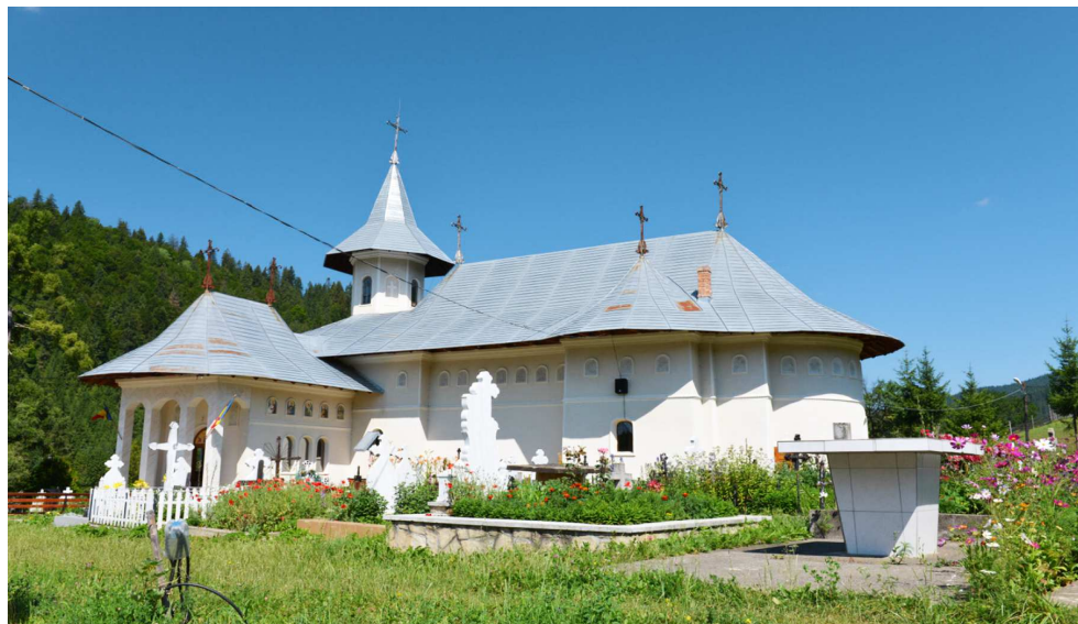
Biserica din vremea copilăriei Părintelui

pe care lumea nu putea să-i mai încapă”, ci au avut un singur împărat, pe „Împăratul împăraților și Domnul Domnilor” (I Timotei 6, 15), pe „Domnuleț și Domn din cer”, precum zice colinda, pe „Cel ce șade de-a dreapta Tatălui și iarăși va să vină să judece vii și morții, a Cărui Împărăție nu va avea sfârșit”.