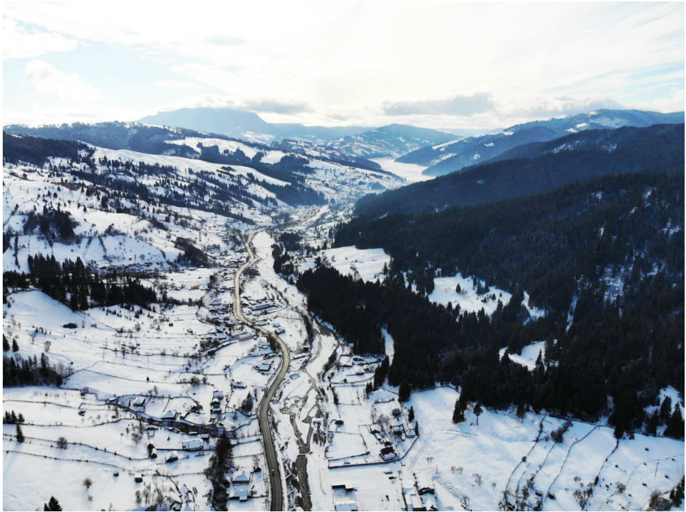
Valea Largului – satul natal al Părintelui

verticală. În familie, în sat și în parohie, omul este legat indisolubil de semenii săi într-o simbioză și unitate întreolaltă cu toată suflarea de la mic la mare, de la tânăr la vârstnic, cu toții într-un prezent continuu, într-o solidaritate umană și la bine, și la rău, și la botez, și la nuntă, și la înmormântare, dar și într-o solidaritate și cu trecutul, cu moșii și strămoșii, cu cei de sub glie și cu responsabilitatea pentru generațiile viitoare prin naștere de prunci și creșterea lor cu bună rânduială. În această dimensiune și-au desfășurat cursul vieții satul, familia și comunitatea parohială la noi, românii, de-a lungul istoriei noastre, căci pe bună dreptate „veșnicia s-a născut la sat”, după zicerea lui Lucian Blaga. Așa au trăit sătenii de pe Valea Largului cea atât de dragă Părintelui, atmosferă în care s-a format în anii copilăriei.